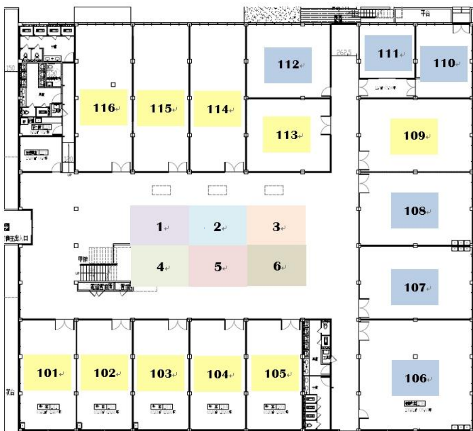
教育館一樓平面圖