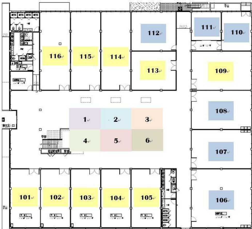
教育館一樓平面圖